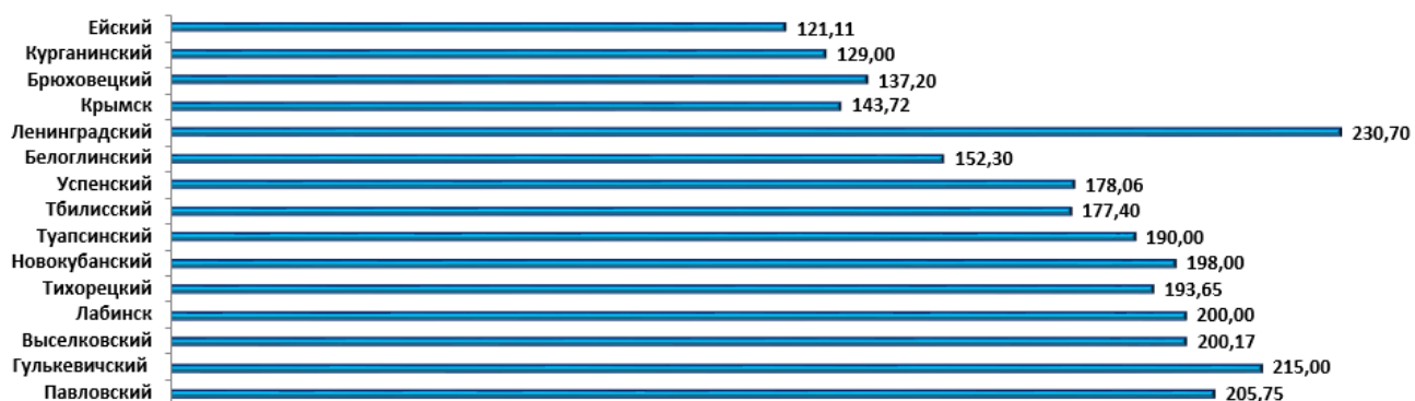
Топ-15 регионов с минимальными розничными ценами на рыбу мороженую неразделанную (лимонема, камбала, треска, хек, сайда, путассу, минтай) в разрезе районов и городов Краснодарского края по состоянию на 10.01.2024 г., руб. за 1кг.