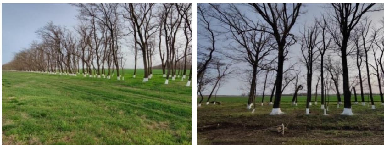
Рисунок 3 – После проведения работ по содержанию агролесомелиоративных насаждений