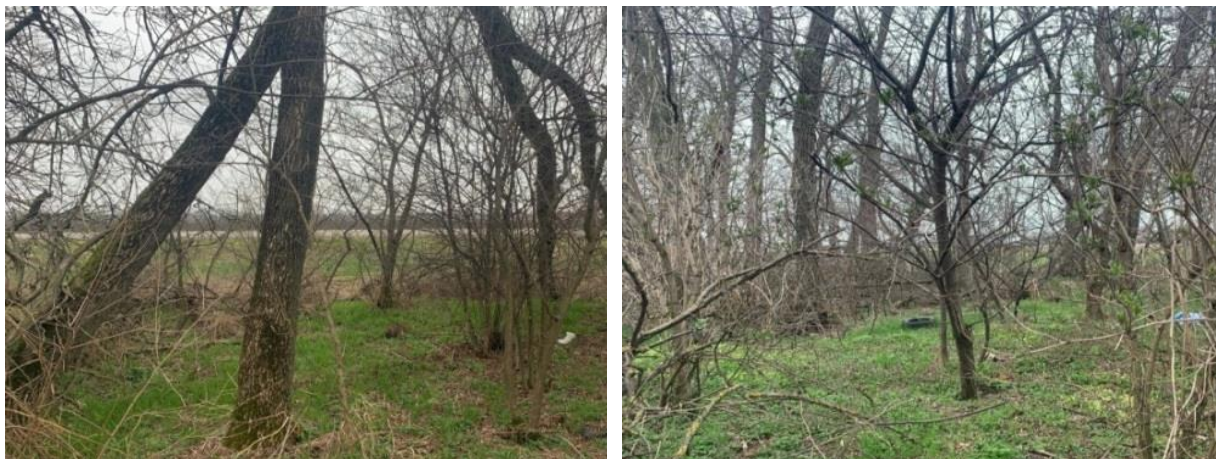
Рисунок 2 – До проведения работ по содержанию агролесомелиоративных насаждений

Контроль за соблюдением технологических приемов при реализации видов работ, указанных в Проекте ухода, обеспечивает заявитель и производитель работ.