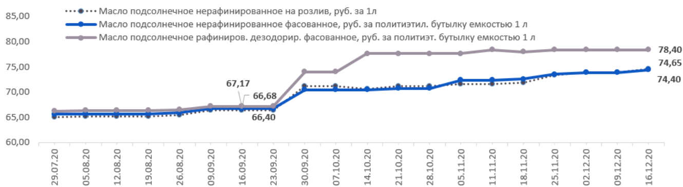
Оптово-отпускные цены предприятий производителей на подсолнечное масло в Краснодарском крае 2020г., руб./л. (РЭК)