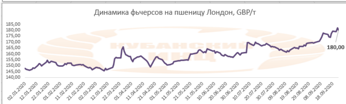
Ближайшие фьючерсы на мировых биржах на зерновые и масличные на 22.09.2020г., $/t