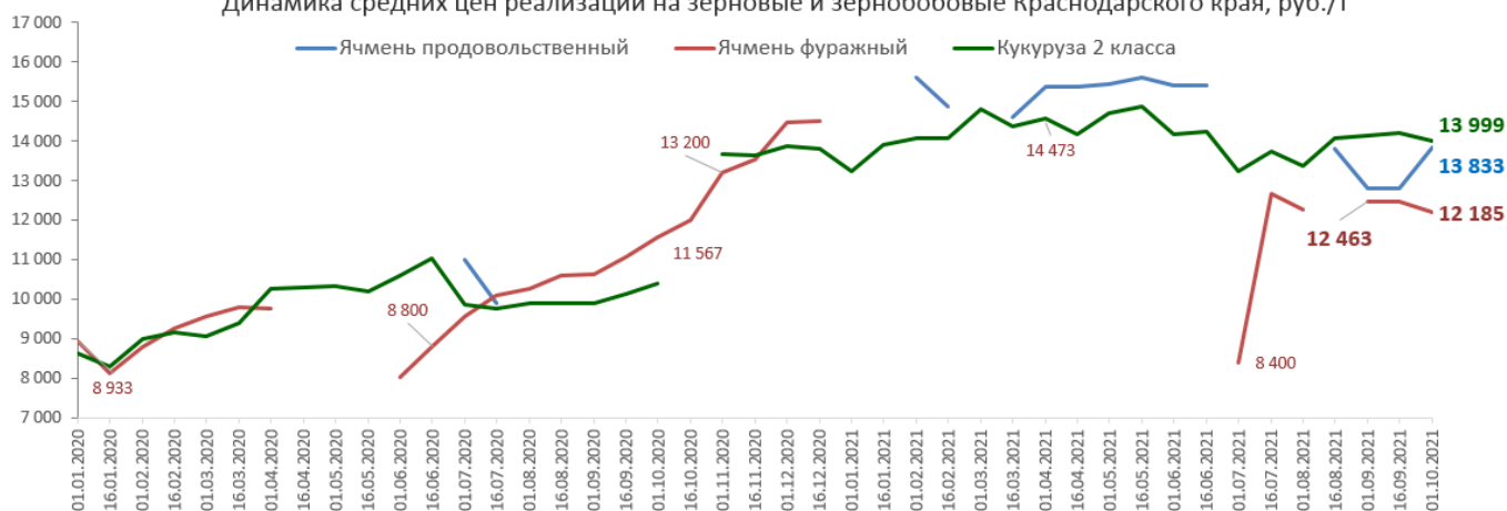
Динамика средних цен реализации на зерновые и зернобобовые Краснодарского края, руб./т