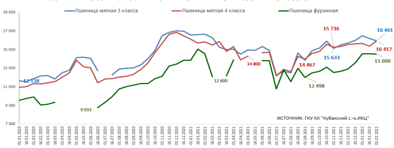
Динамика средних цен реализации на зерновые в Краснодарском крае, руб./т