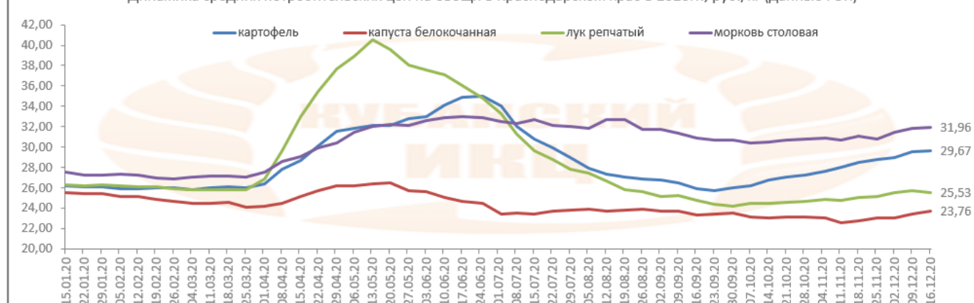
Средние потребительские цены на овощи и фрукты в городах Краснодарского края на 21.12.2020 года (данные Крайстат)