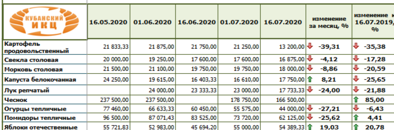
Динамика средних цен сельхозпроизводителей на реализованную продукцию в 2020 году, руб./тн (данные ГБУ КК "Кубанский сельскохозяйственный ИКЦ")