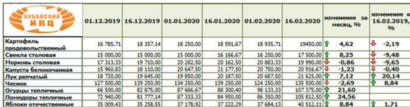
Динамика средних цен сельхозпроизводителей на реализованную продукцию в 2019-2020 году, руб./тн (данные ГБУ КК "Кубанский сельскохозяйственный ИКЦ")