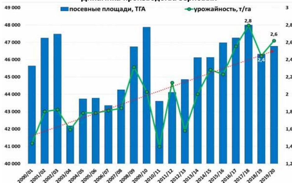
Динамика производства зерновых

Производство всех зерновых и бобовых культур, по предварительной оценке, Росстата составило 120,6 ММТ (+7,4 ММТ к 2018 г.). В т.ч. валовой сбор пшеницы вырос на 2,2 ММТ до 74,3ММТ.