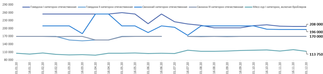
Динамика оптово-отпускных цен производителей мясной продукции в Краснодарском крае в 2020 г., руб./тн. (данные ГКУ КК "Кубанский сельскохозяйственный ИКЦ")