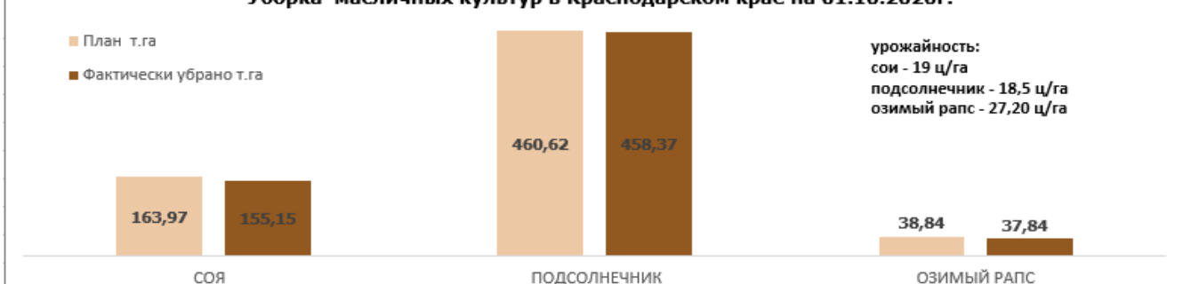
Уборка сои и подсолнечника в Краснодарском крае по состоянию на 01.10.2020 года